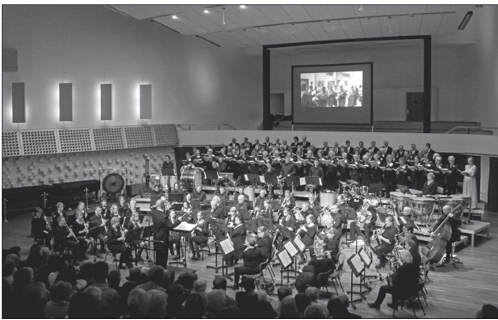
Harmonieorkest Prinses Irene tijdens het jubileumconcert.

Sommige senioren geven aan dat de zomerperiode een wat stille tijd kan zijn. De vaste activiteiten stoppen en familie en bekenden gaan op vakantie. Daarom deze inloop waar u gewoon langs kunt komen, zonder aanmelding vooraf. Mocht het vervoer een probleem zijn, laat het weten, dan zoekt Versa Welzijn samen met u naar een oplossing. Plaats: Wijkcentrum 't Vuronger, Schoolstraat 6, 1271 SC Voor meer informatie: Anneke van der Veer, sociaal werker www.versawelzijn.nl, tel. 035-3034 688.