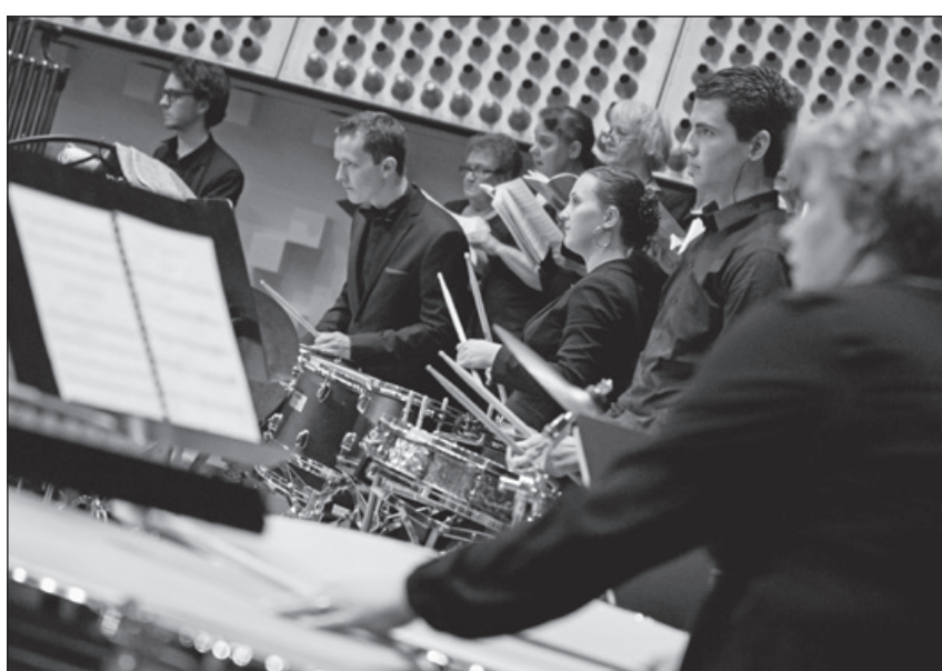
Slagwerkgroep Harmonieorkest.

Het Benedictus, gezegend is Hij die komt in de naam des Heren, gaat over Jezus als Vredestichter. Jesaja profeteert de komst van een Vredesvorst Die de wereld van onrecht zou bevrijden. Zij zullen hun zwaarden tot ploegscharen omsmeden. Geen volk zal tegen een ander volk zijn zwaard opheffen, en zij zullen de oorlog niet meer leren. Het slotdeel 'Better is Peace' met een tekst uit de King Arthur legendes van Thomas Malory sluit daar perfect op aan. Lancelot: Vrede is beter dan altijd maar